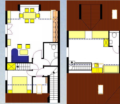
Obergeschoßwohnungen mit 2. Ebene